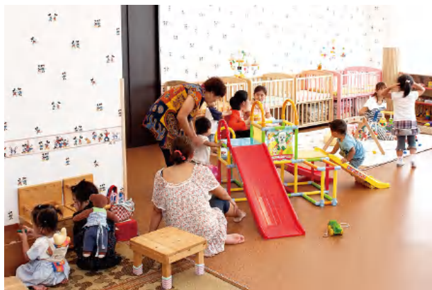
子育てリラックス館

「2019 千葉幸町サマーカレッジ」もこれらの活動の一環として行われ、“多様な世代が生き生きと暮らし続けられる住まい・まち（ミクストコミュニティ）”の実現を目指して、UR賃貸住宅の付加価値向上を図り、少子高齢化など社会課題の解決に寄与するための先導的な事業モデルを構築し、ミクストコミュニティ形成を更に推進します。