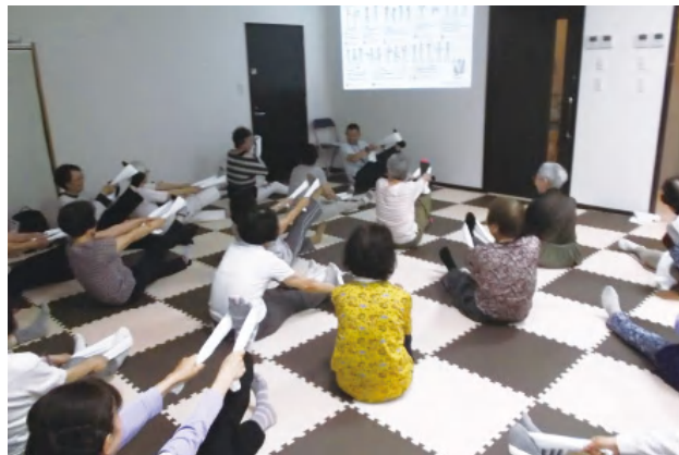
地域交流スペース